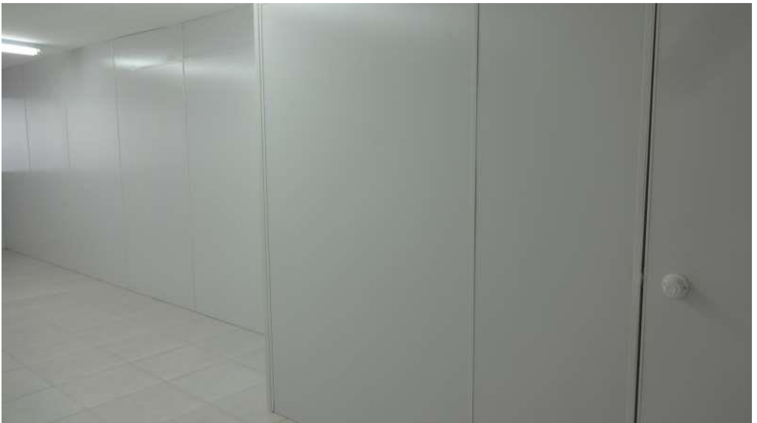
Modelo e cor das divisórias (SEM VIDRO)